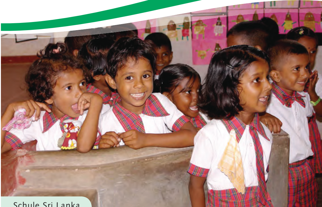
Schule Sri Lanka

Ländername: Demokratische Sozialistische Republik Sri Lanka Größe: 65.610 km 2 Bevölkerung: 20,2 Millionen Landessprachen: Singhalesisch, Tamil, Englisch Hauptstadt: Colombo